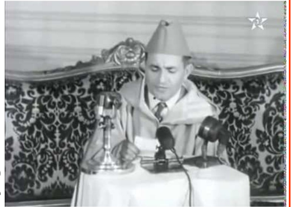
خطاب محمد الخامس بعد عودته من المنفى 1955.